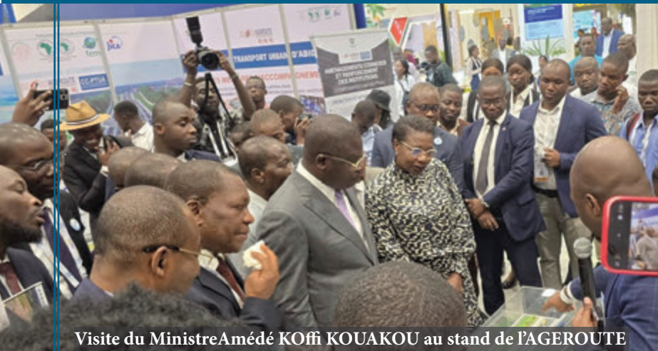
Visite du Ministre Amédé KOFFI KOUAKOU au stand de l'AGERROUTE